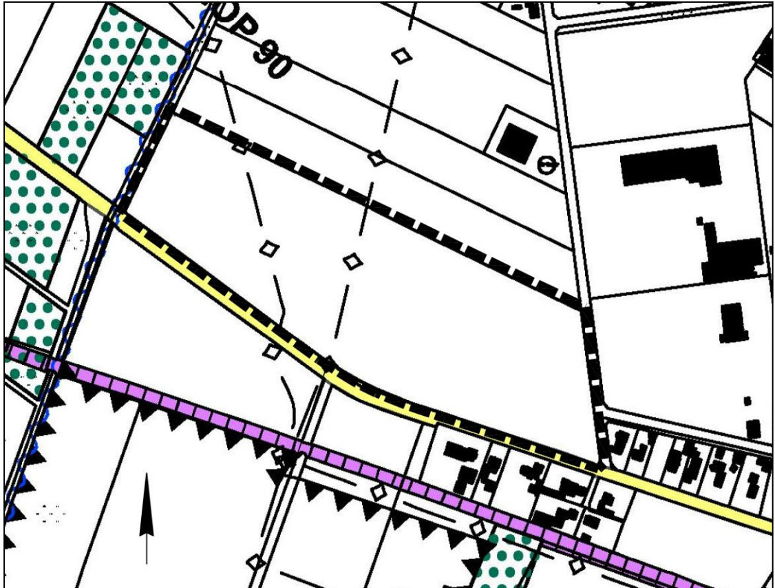
Abb.: Ausschnitt aus dem wirksamen Flächennutzungsplan (FNP) 2005 der Gemeinde Bösel. Bereich der geplanten 7. Änderung des FNP durch unterbrochene Umrisslinie markiert. Ohne Maßstab.